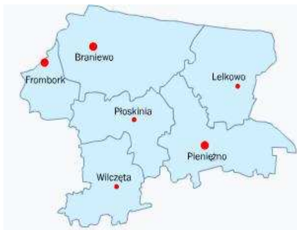
Mapa Powiatu Braniewskiego

Na terenie powiatu zlokalizowane są 3 miasta (Braniewo, Frombork i Pieniężno) oraz 97 miejscowości sołeckich oraz 189 miejscowości wiejskich.